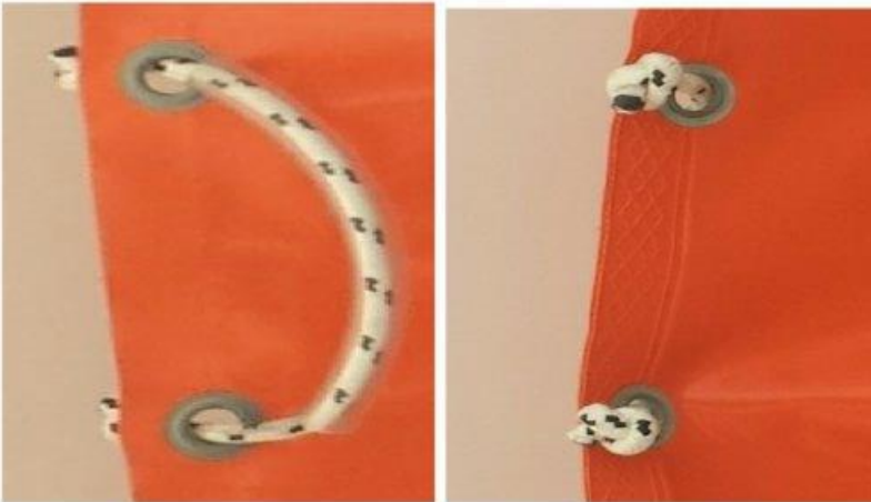
Detalj 1. iz troškovnika