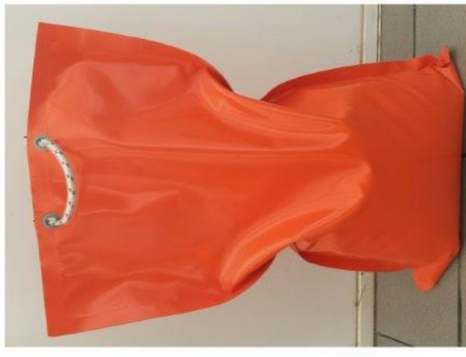
Slika PVC vreće za otežavanje prometne signalizacije